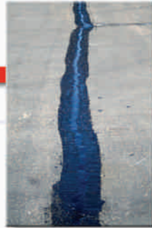
Juntas de Pavimentado

PolyPatch PN# Type 1-34281 / Type2-34282 / Type3-34283 PolyPatch Fine Mix Type 1-34284 / Type2-34285 / Type3-34286 Mastic One PN# 33339