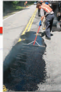
Preparación de superficies