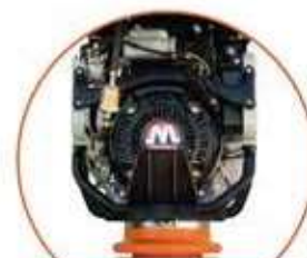
Protector de Arranque